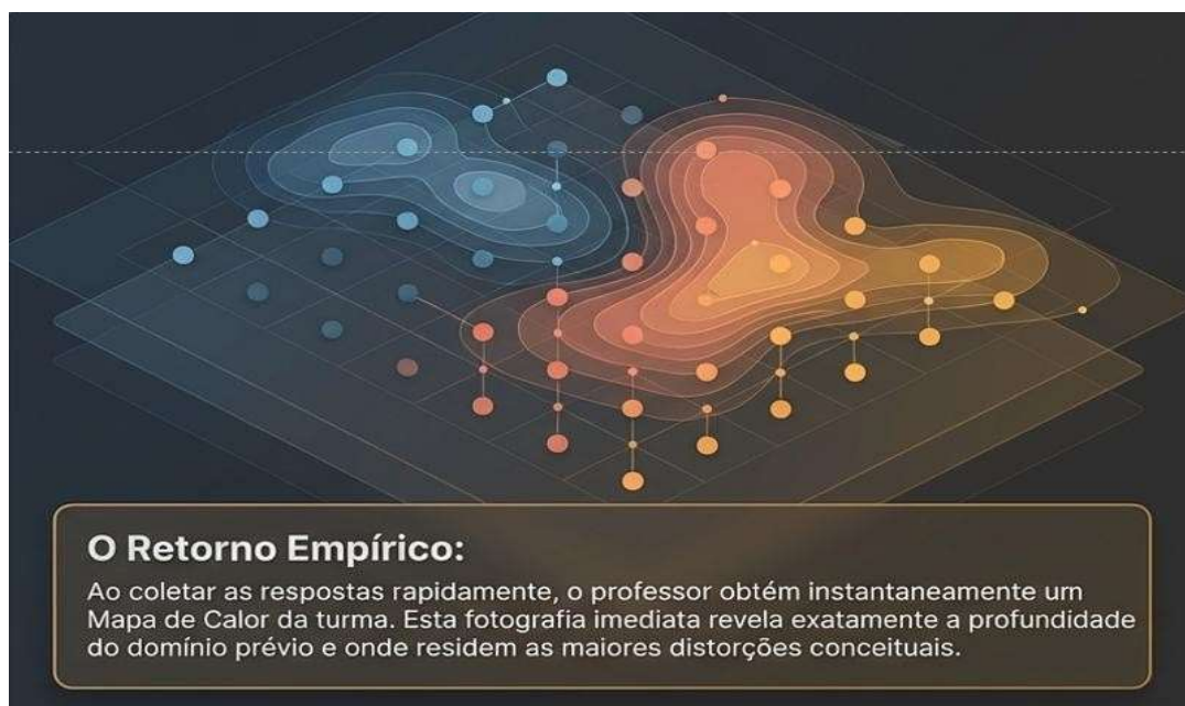
Figura 1 – Mapa de calor das respostas dos estudantes.