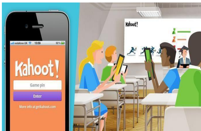
Imagem 1 – alunos utilizando o Kahoot!